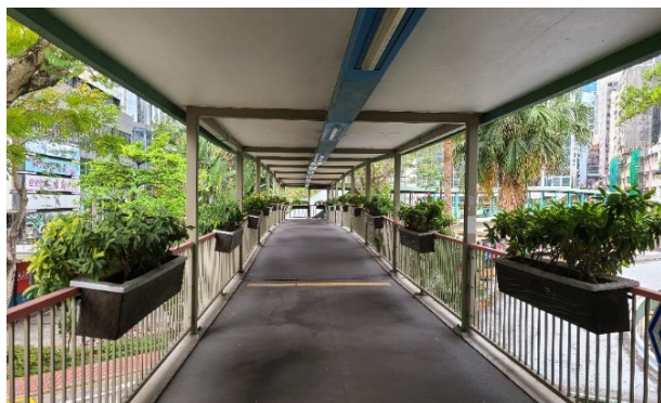
行人天桥上的栏杆花槽