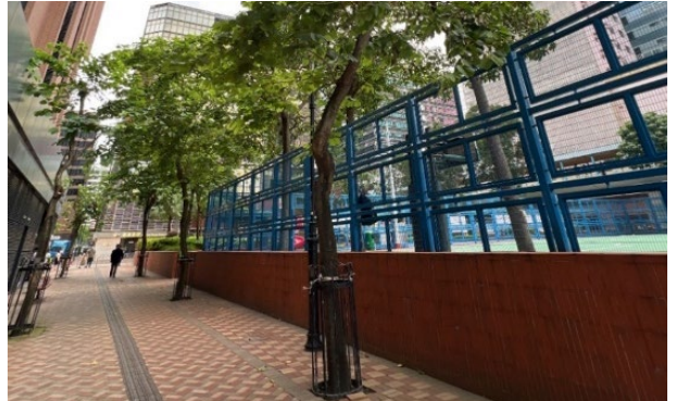
行人路上栽种的树木