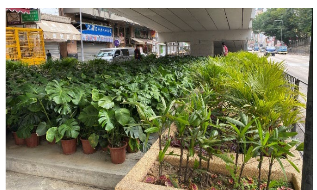
行车天桥下的绿化工程