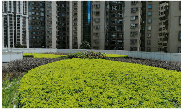
社区中心的屋顶绿化