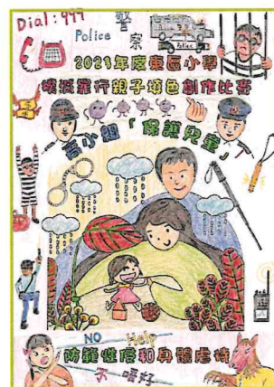
高小組 漢華中學(小學部) 容芷琳