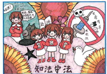
中學組 明愛柴灣馬登基金中學 韓文莉